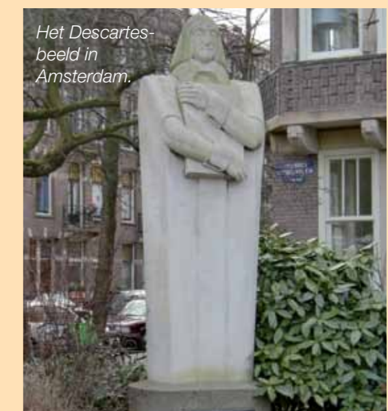
Het Descartes-beeld in Amsterdam.

Het is schitterend dat je steun kunt vinden in het idee dat iemand in het verre verleden echt zijn best heeft gedaan om het begrip pijn te doorgronden